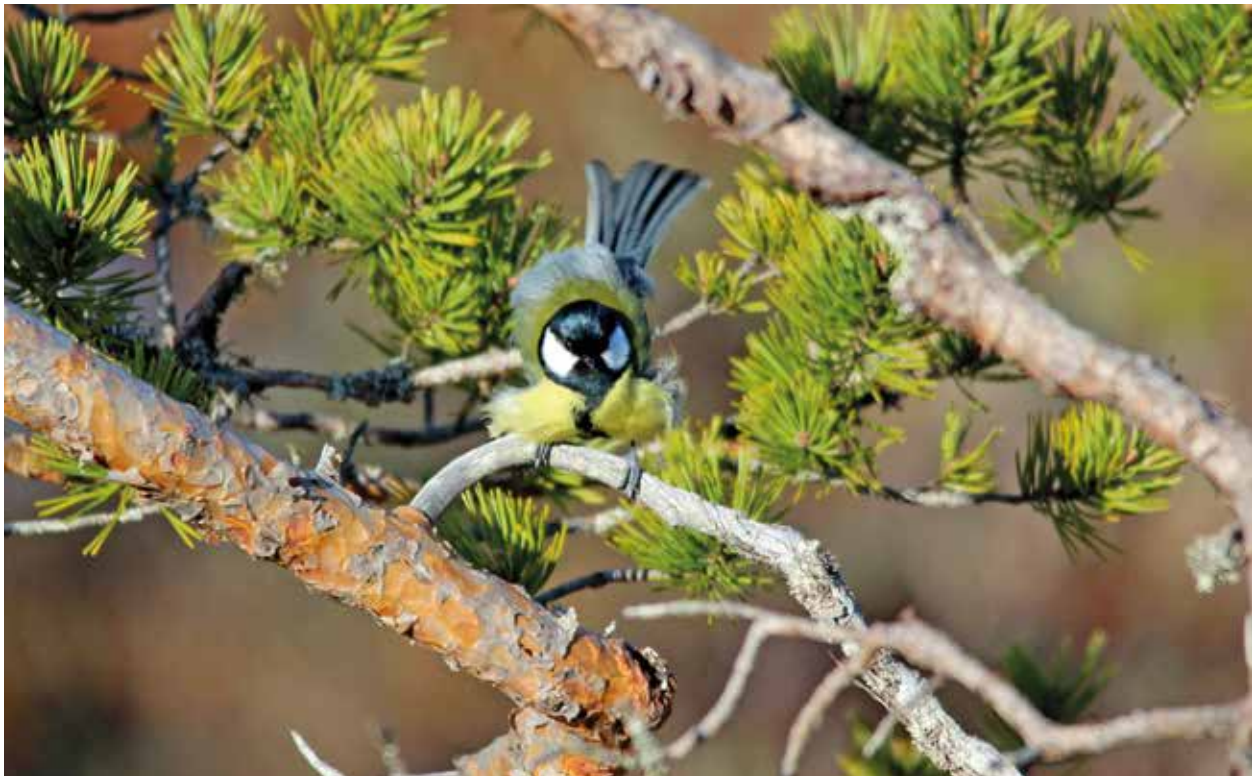
Talitiainen Tornien taistolta 2023.