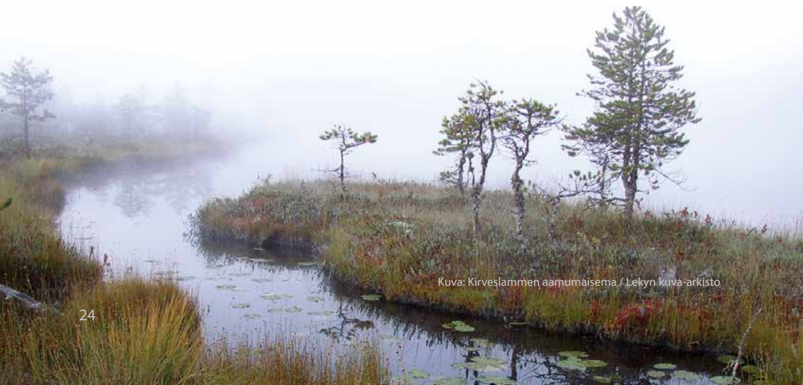
Kuva: Kirveslammen aamumaisema / Lekyn kuva-arkisto